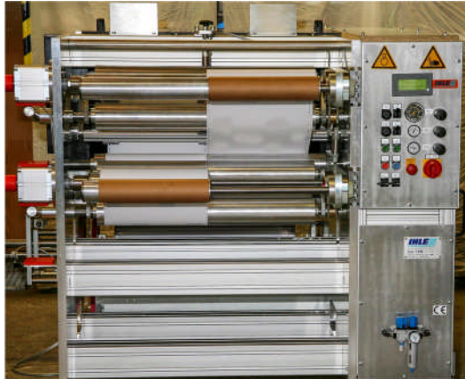
Grundaufbau der Maschine

Der steife Grundaufbau der Maschine durch präzisionsgefräste Stahlgrundplatte mit verschraubten Aluminiumrahmen führt zu einem vibrationsarmen Lauf der Maschine. Das Ergebnis ist eine optimale und gleichbleibende Wickelqualität.