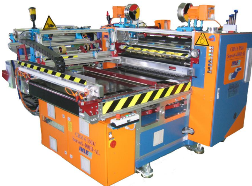
CRM 6 Baureihe

Thermotransfer, Hot Stamping, Hologramm und vergleichbare Produkte